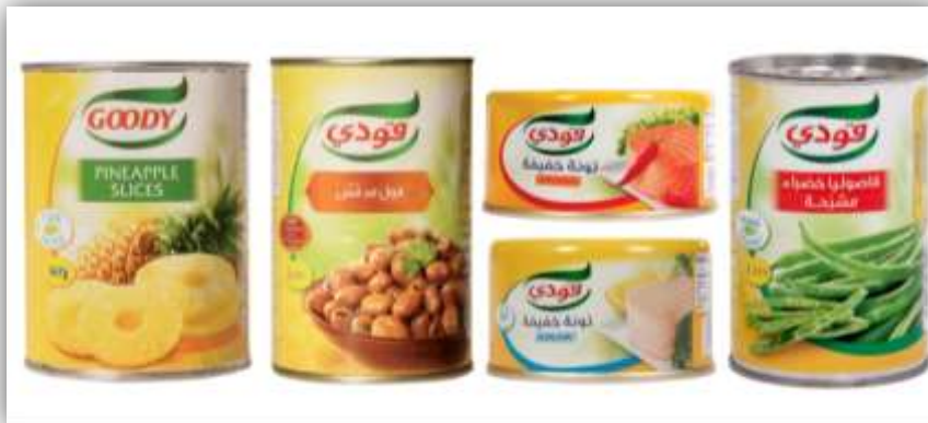
ตัวอย่างสินค้าอาหารแปรรูปบรรจุกระป๋องชนิดต่าง ๆ ของบริษัท Basamh Trading ผู้ผลิตอันดับ 1 ภายใต้ตรา 'Goody'