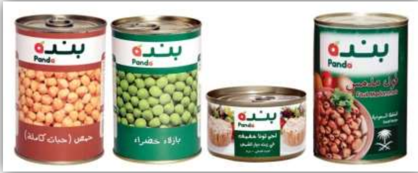
ตัวอย่างสินค้าอาหารแปรรูปบรรจุกระป๋องชนิดต่าง ๆ ของห้างค้าปลีก Panda ภายใต้ตราห้าง