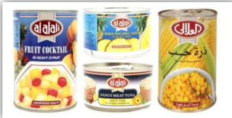
ตัวอย่างสินค้าอาหารแปรรูปบรรจุกระป๋องชนิดต่าง ๆ ของบริษัท Basamh Marketing ภายใต้ตรา 'Al Alali'