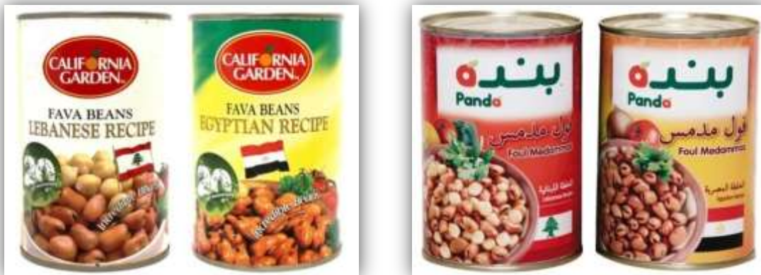
ตัวอย่างสินค้าถั่วแปรรูปบรรจุกระป๋องที่มีรสชาติแบบเลบานอนและแบบชาวอียิปต์ของบริษัท Gulf Food Industries ภายใต้ตรา 'California Garden' (ซ้าย) และห่านค้าปลีก Panda ภายใต้ตราห่าน (ขวา)