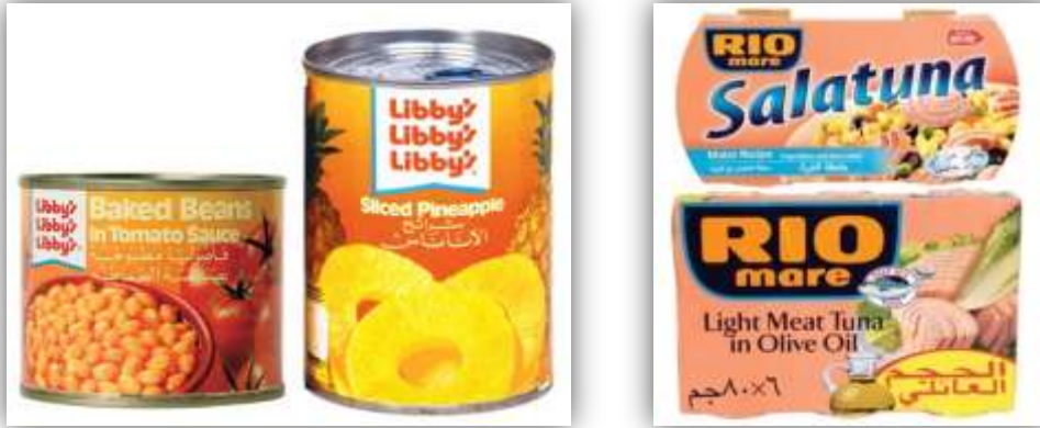
ตัวอย่างสินค้าอาหารแปรรูปบรรจุกระป๋องของบริษัทข้ามชาติ บริษัท Nestle ภายใต้ตรา 'Libby's' (ซ้าย) และบริษัท Bolton Alimentari ภายใต้ตรา 'Rio Mare' (ขวา)