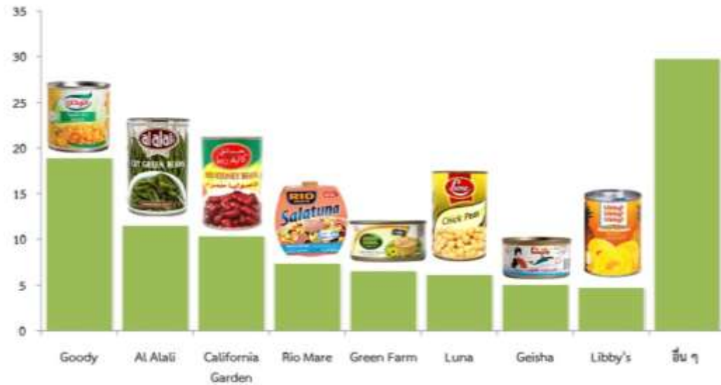
รูปที่ 3 ส่วนแบ่งมูลค่าการตลาดอุตสาหกรรมอาหารแปรรูปบรรจุกระป๋องของซาอุดีอาระเบีย จำแนกตามตราสินค้าสำคัญ ปี 2556